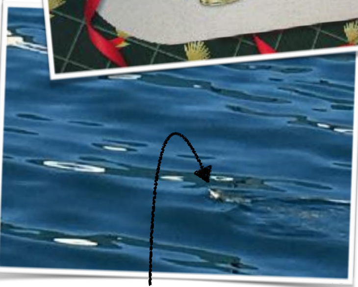
Reisebericht Nr. 2