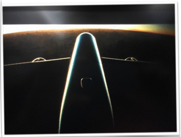
Sonnenaufgang über Neuseeland, aufgenommen mit der Heckkamera Reisebericht Nr. 1